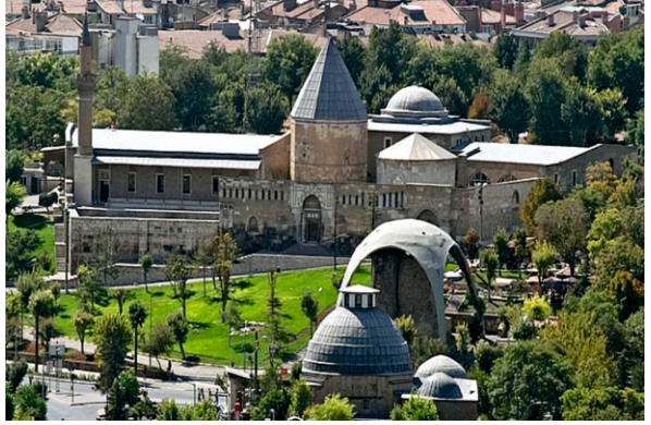
► Alaaddin Tepesi