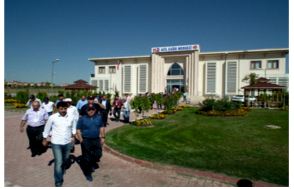
► 112 Acil İstasyon