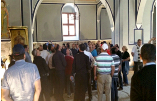
► Aya Elenin Kilisesi