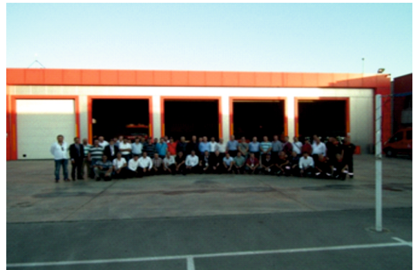
► İtfaiye Dairesi Başkanlığı