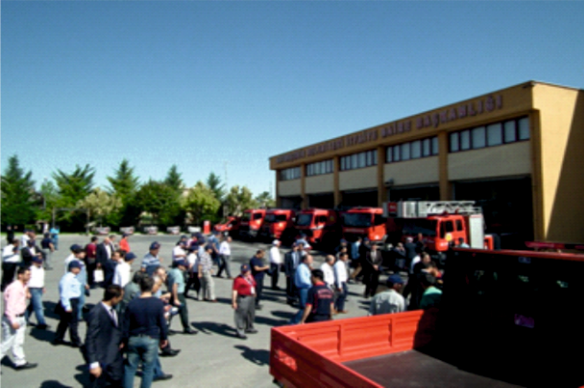
► İtfaiye Eğitim Merkezi